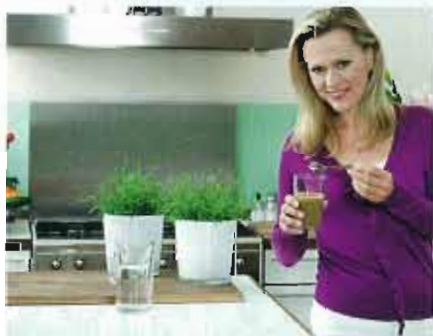
Seit über 100 Jahren bewährt, jetzt auch mikrofein erhältlich: Heilerde.

Darüber hinaus kann Luvos-Heilerde mikrofein Gallensäuren binden, so dass diese vermehrt ausgeschieden werden. Da Gallensäuren aus Cholesterin gebildet werden, kann dies zusätzlich zu einem positiven Einfluss der Heilerde auf den Cholesterinspie-