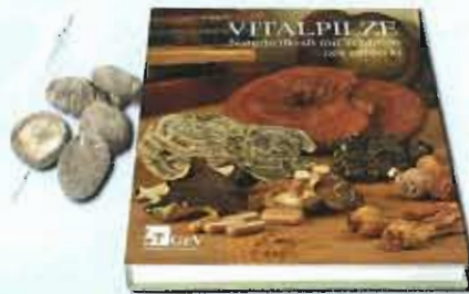
Vitalpilze und ihre Anwendung – umfassend dargestellt im neuen Standardwerk.

Luvos Just GmbH & Co. KG Otto-Hahn-Str. 23, 61381 Friedrichsdorf www.luvos.de