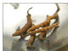
Der chinesische Raubenpilz wirkt sehr belebend.

Da die Frauen viel seltener als Männer mit einer körperlichen Dysfunktionalität beim Sex zu kämpfen haben und zudem in den letzten Jahrzehnten sexuell viel selbstbewusster geworden sind, werden es in Zukunft eher die Männer sein, die für die Probleme beim Sex im Alter verantwortlich sind. Neben körperlichen Ursachen sind Stress und ein zu hoher Erwartungs- und Leistungsdruck häufig Gründe für Libidostörungen. Aus diesem Umstand werden sich neue Veränderungen ableiten lassen: Auf den Märkten – von der Beratung bis zur Pharmakologie – entsteht